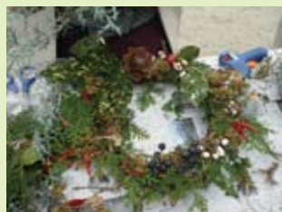
ネイチャークラフト