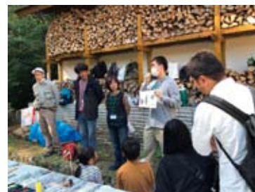
イベント実施の様子