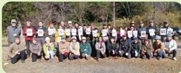
大阪府民の森パークレンジャー 30周年