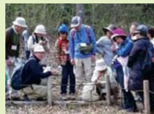
ネイチャーガイド